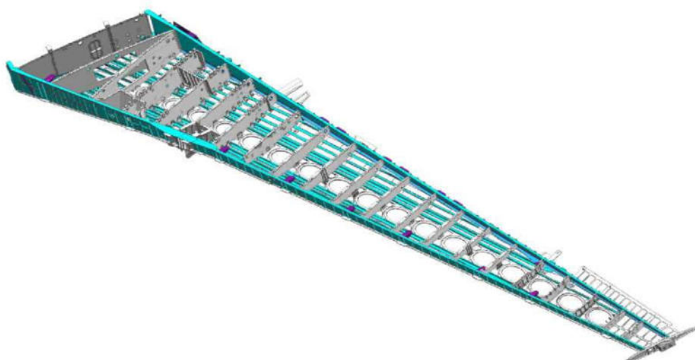
Рисунок 2 - Кессон ОЧК

Отверстия под установку болтов и болт - заклепок разделяются по Н8.